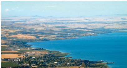
Meer van Galilea