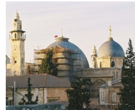
Heilige Grafkerk, Jeruzalem

Twee dagen in het Noorden van Israël waarin we een aantal plaatsen bezoeken die te maken hebben met het verborgen en openbaar leven van Jezus.